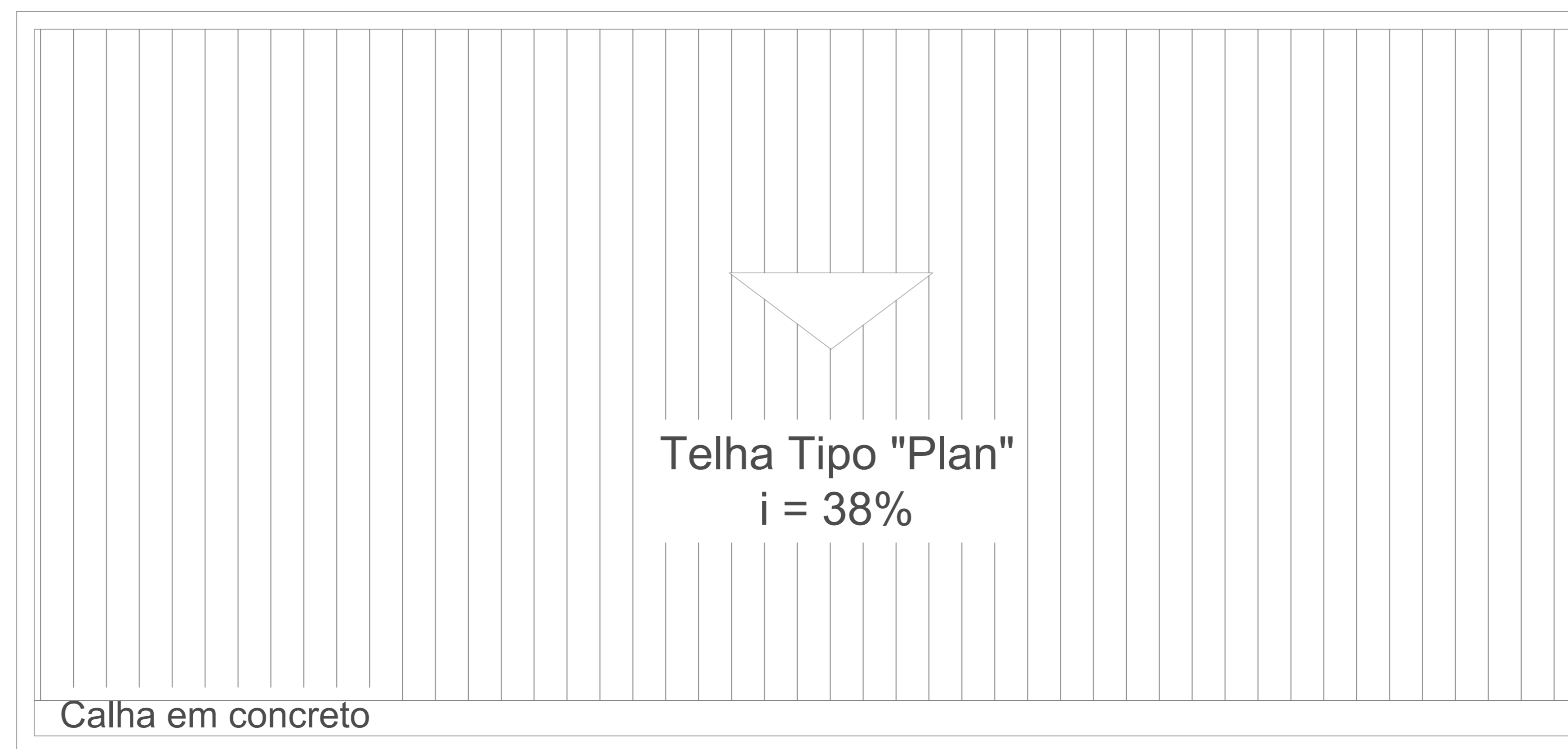
Planta Cobertura - Pav. Sup.