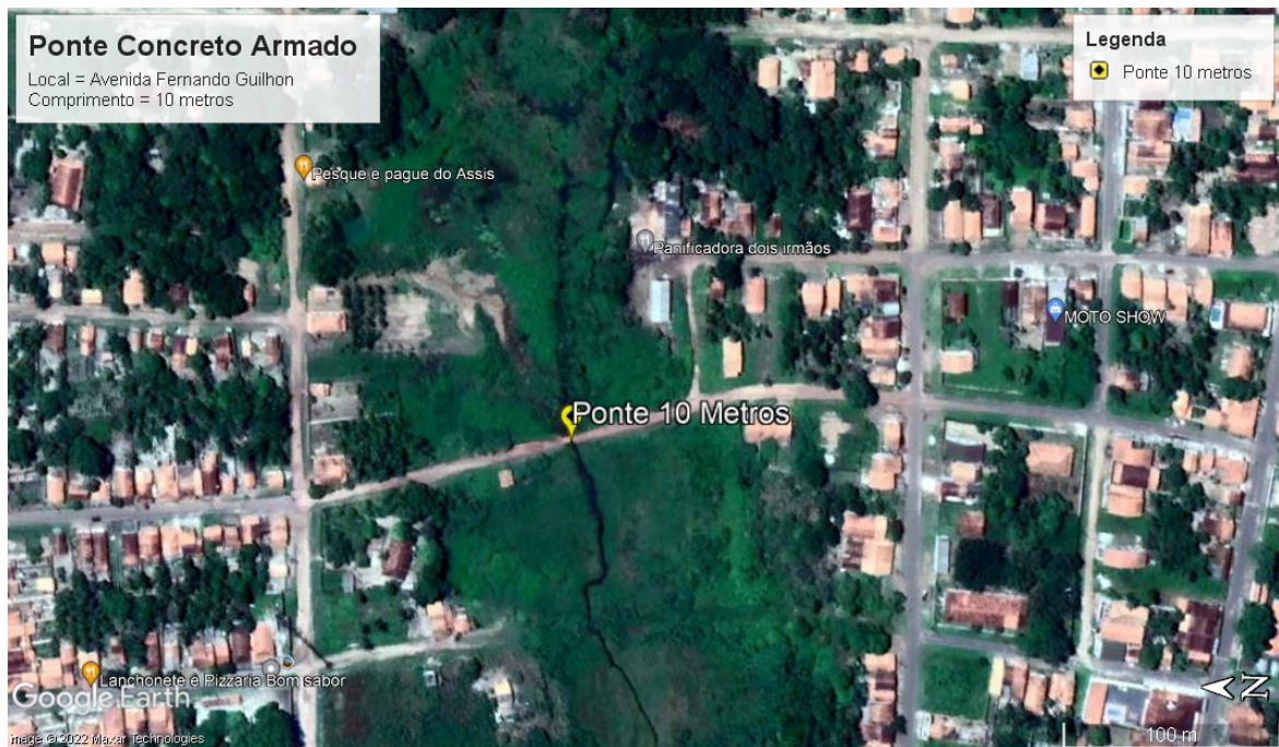
FOTO 5 - Ponte na Avenida Fernando Guilhon / 10 metros de comprimento