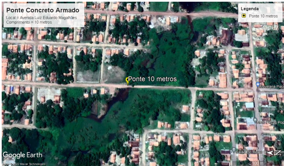
FOTO 7 – Ponte na Avenida Luiz Eduardo Magalhães / 10 metros de comprimento