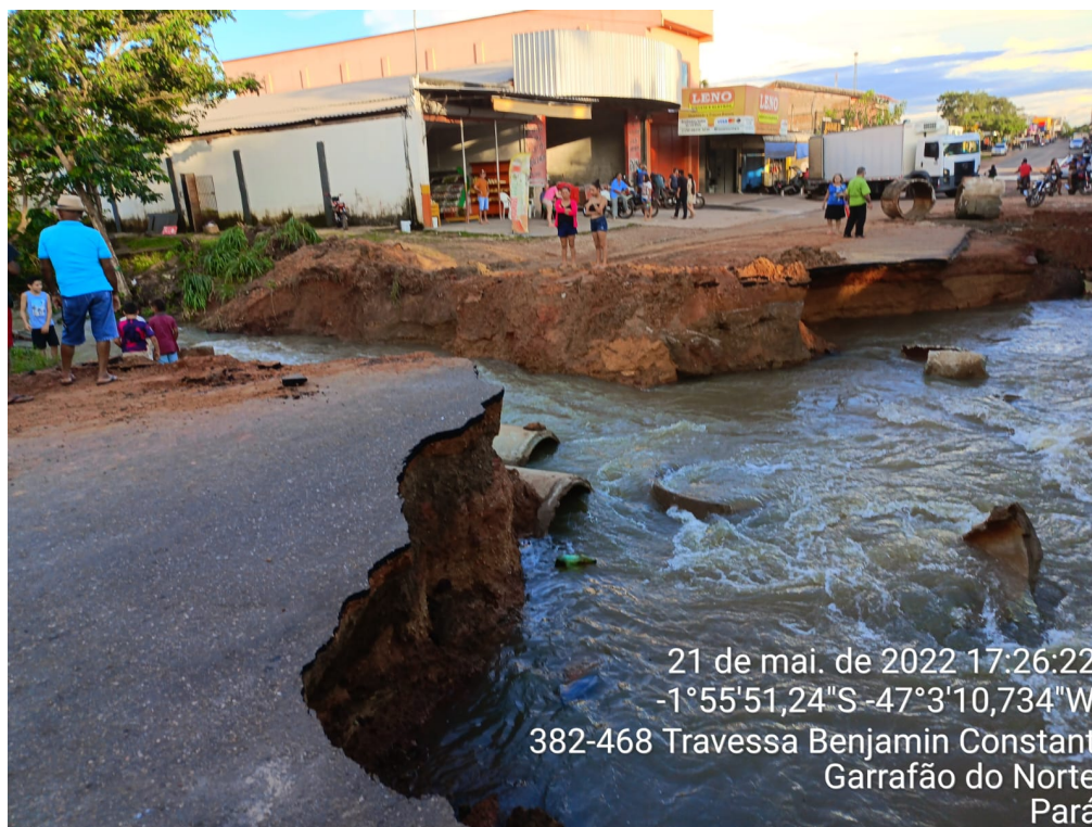
FOTO 2 - Desastre em via pública.