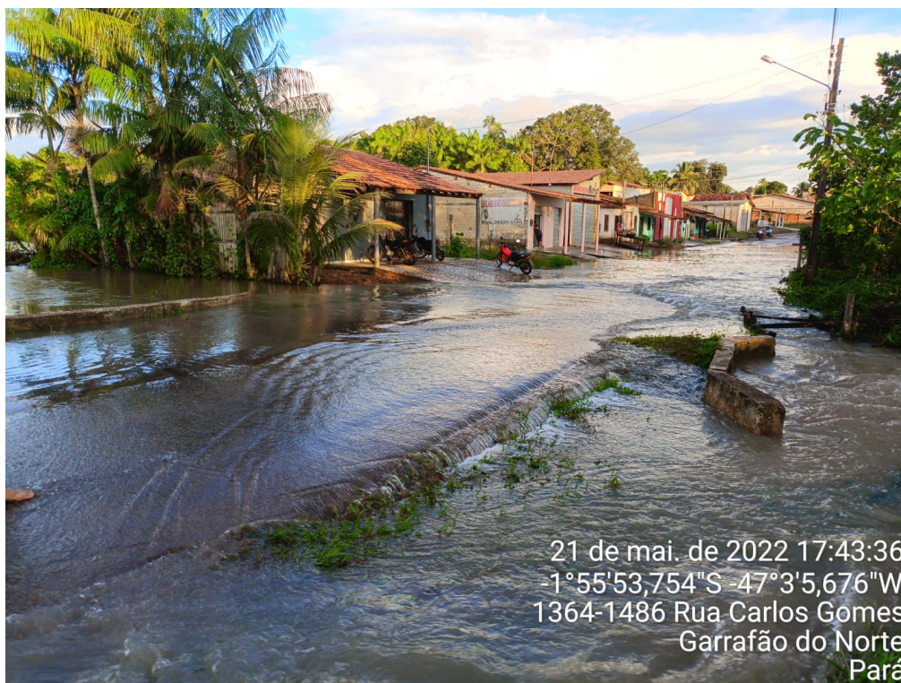
FOTO 4 – Via coberta por água inviabilizando a passagem de moradores.