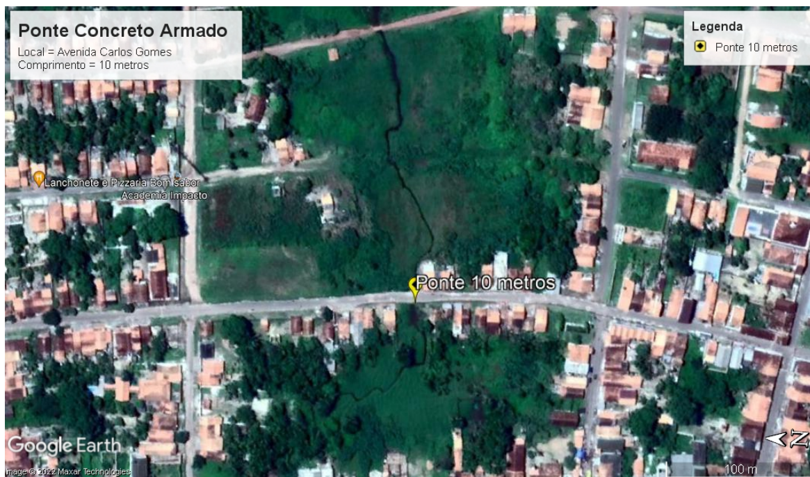
FOTO 3 – Ponte na Avenida Carlos Gomes / 10 metros de comprimento