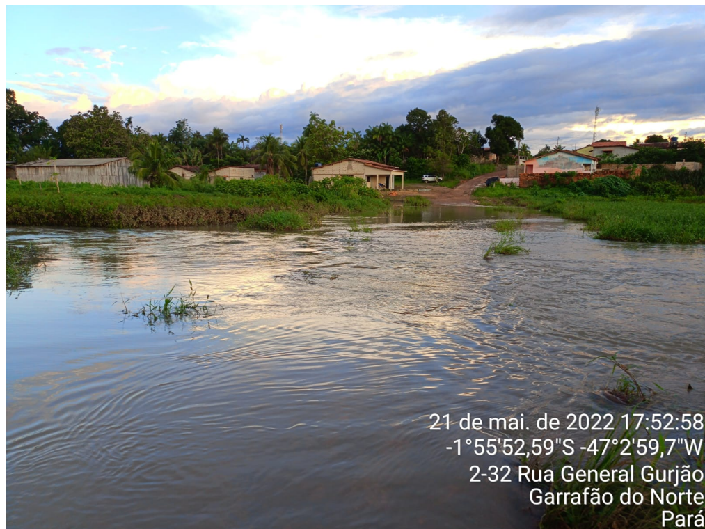
FOTO 6 - Via coberta por água inviabilizando a passagem de moradores.