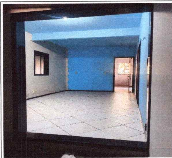
ESPAÇO INTERNO LIVRE

PREFEITURA MUNICIPAL DE GARRAÇÃO DO NORTE CNPJ:22.980.940/0001-27