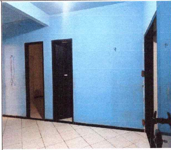
ESPAÇO INTERNO LIVRE