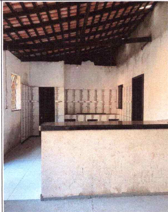
ÁREA DE SERVIÇO