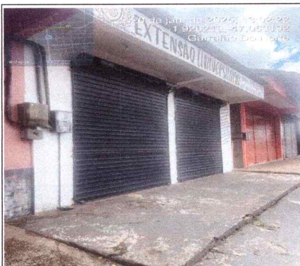
VISTA LATERAL DO IMÓVEL