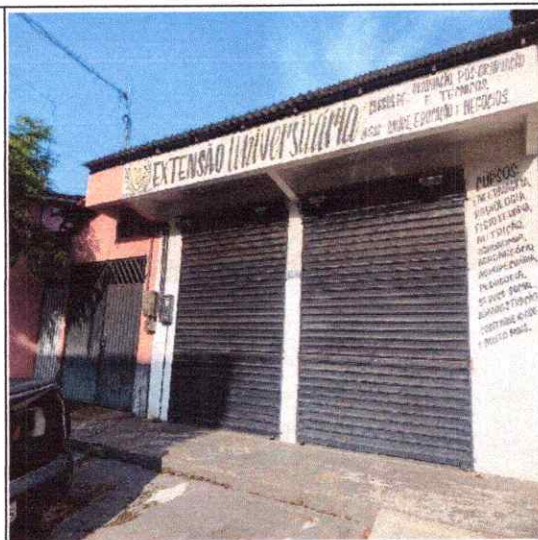
VISTA FRONTAL DO IMÓVEL