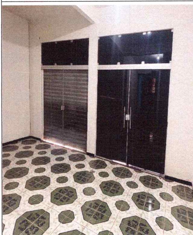
ESPAÇO INTERNO LIVRE