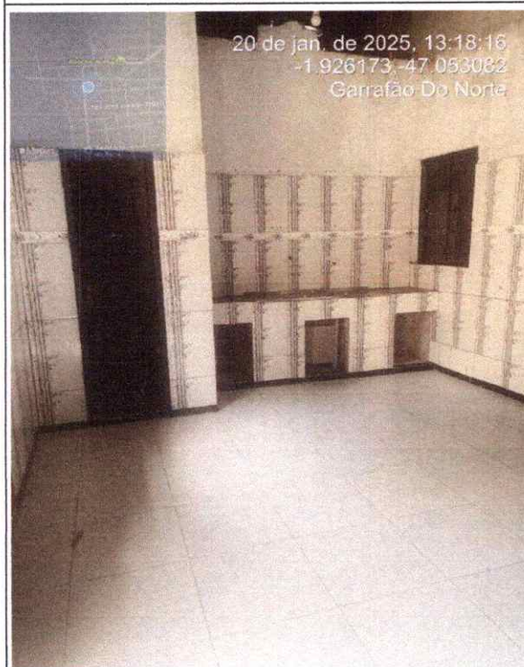
ÁREA DE SERVIÇO