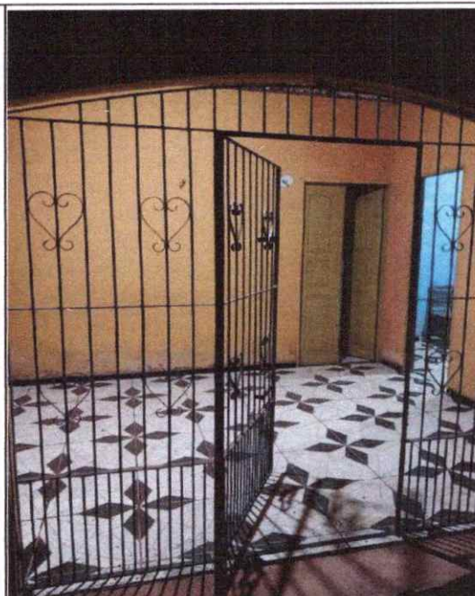
VISTA FRONTAL DO IMÓVEL