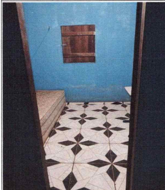
QUARTO - 01