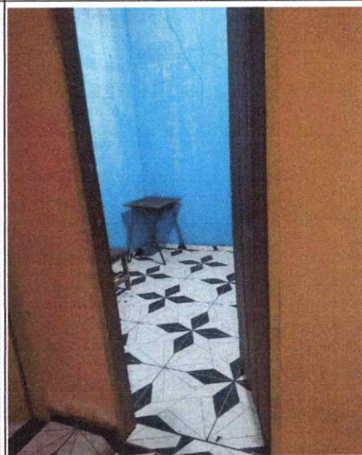
QUARTO - 02