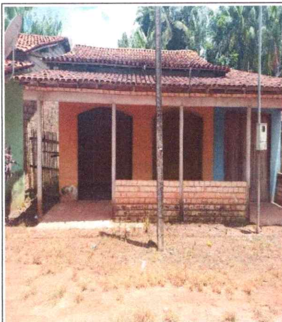
VISTA FRONTAL DO IMÓVEL